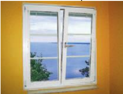
B – Kipp-dreh funktion i ventilationsläge.