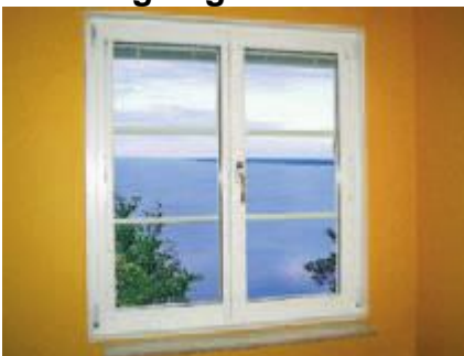
A – Kipp-dreh funktion i stängt läge.