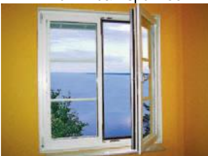
C – Kipp-dreh funktion i putsläge.